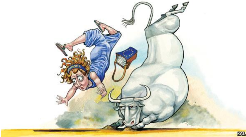
Bucked off (The Economist 31 May-6 June 2014)

全体として EU が自信を喪失している中で、欧州委員会及び各国が推進してきたエネルギー環境政策も困難に直面している。